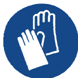
Gants de protection

Choix du matériau des gants en fonction des temps de pénétration, du taux de perméabilité et de la dégradation.