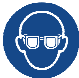
Lunettes de protection hermétiques